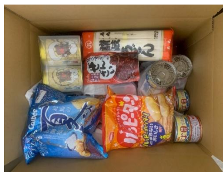
寄付いただいた食品の写真（一例）