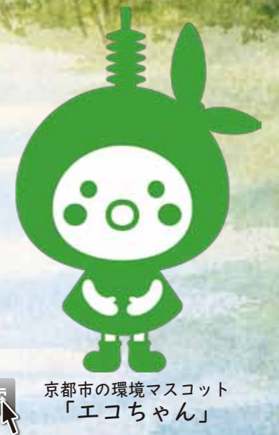
京都市の環境マスコット「エコちゃん」