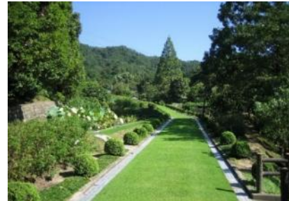
京都薬用植物園 中央標本園

本事業における保全対象種の苗の確保及び提供については、本協定に基づく連携・協力事項の一つとして、御協力いただくものです。