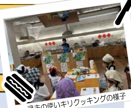
過去の使いキリクッキングの様子

京都市及び株式会社 Mizkan Holdings（ミツカン）は、「食品ロス削減に資する取組の連携に関する協定」に基づき、食品ロス削減のため、様々な取組を推進しています。