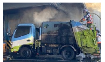
京都市のごみ収集車の火災被害状況