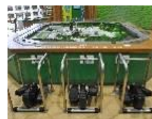
発電体験コーナー