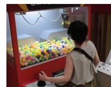
ごみクレーン操作体験