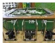
発電体験コーナー