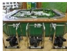
発電体験コーナー