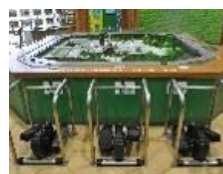
発電体験コーナー