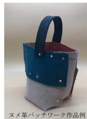
ヌメ革パッチワーク作品例

さすてな展望台や屋上広場の足湯、定時工場見学ツアー（午前10時、午後2時）などと併せてお楽しみください。