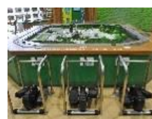
発電体験コーナー