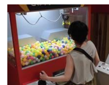
ごみクレーン操作体験

(※ 無料シャトルバスは、10月22日、12月31日を除く日曜日に運行します。)