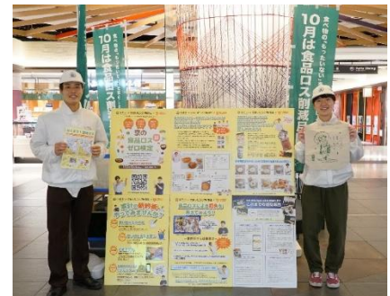
昨年度のキャンペーンの様子

今年度は、全ての会場で、御家庭で不要になった食品を持ち寄っていただく「フードドライブ」を実施し、集まった食品はフードバンク団体を通じて福祉施設等に寄付します。