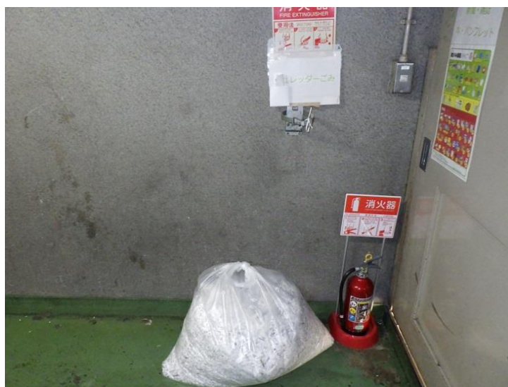
③シュレッダーごみ