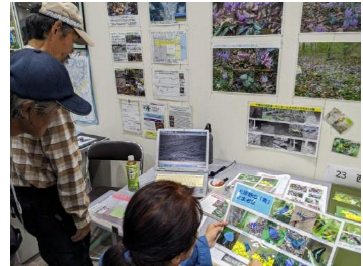
きょうと☆いきものフェス!2023 ブース展示