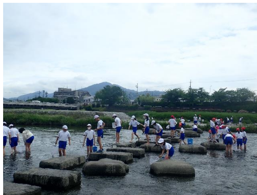
宝が池：宝が池連続学習会