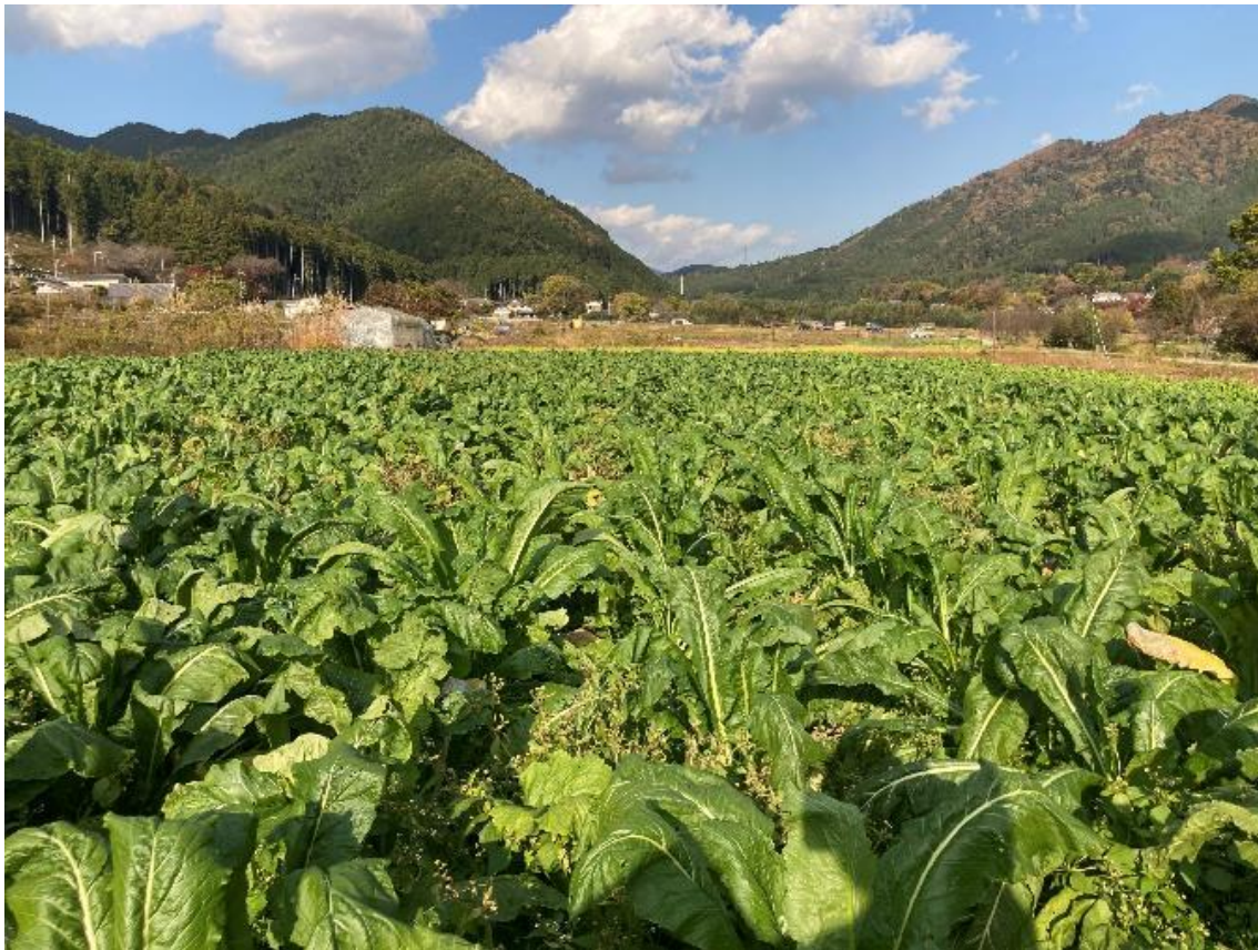
環境にやさしい農業技術の実証 (化学肥料使用量の削減)