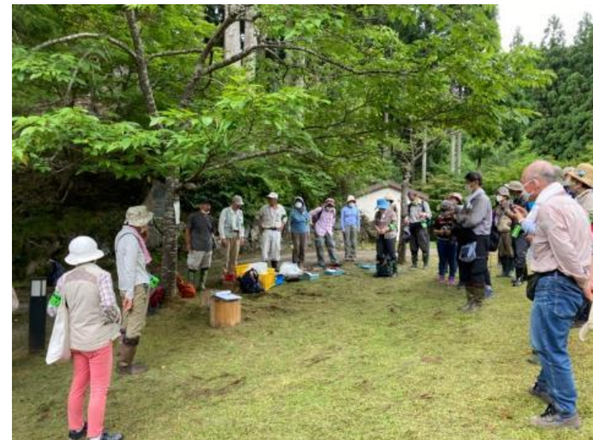
オオハンゴンソウ駆除活動