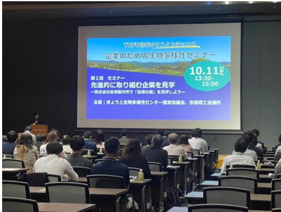
第2回企業向けセミナーの様子