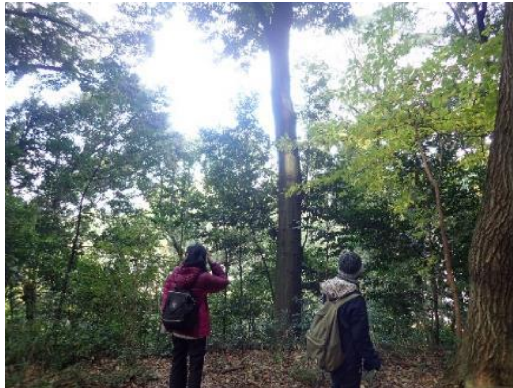
自然観察会試行実施の様子