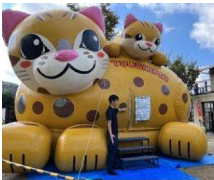
やまねこ博覧会での様子