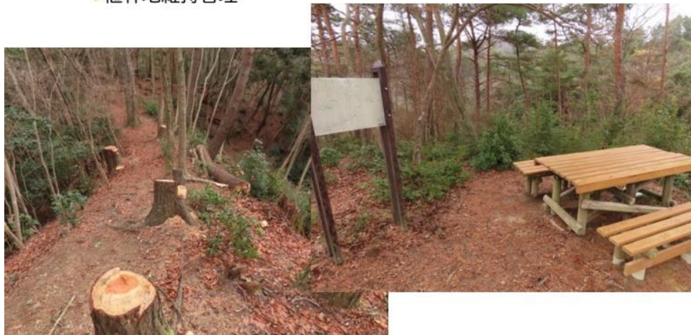
大原野森林公園における維持管理 (ポータルサイト掲載資料抜粋)