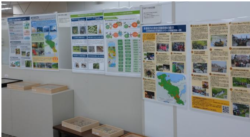
交流オフィス パネル展示