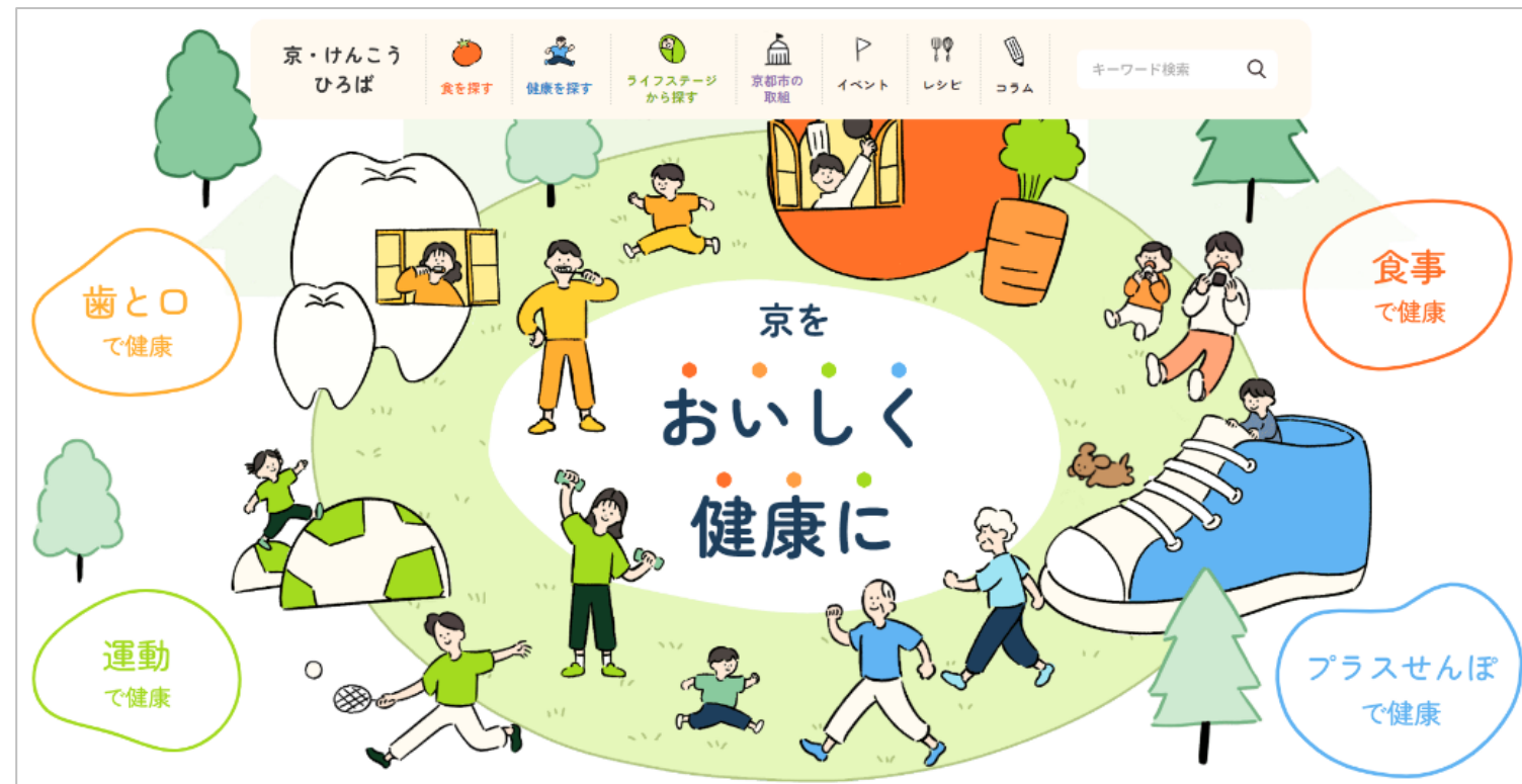
ホームページ「京・けんこうひろば」