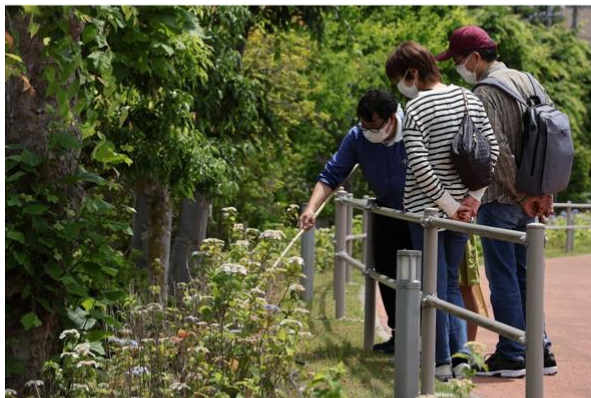
イベントの様子（アジサイ関連プログラム）