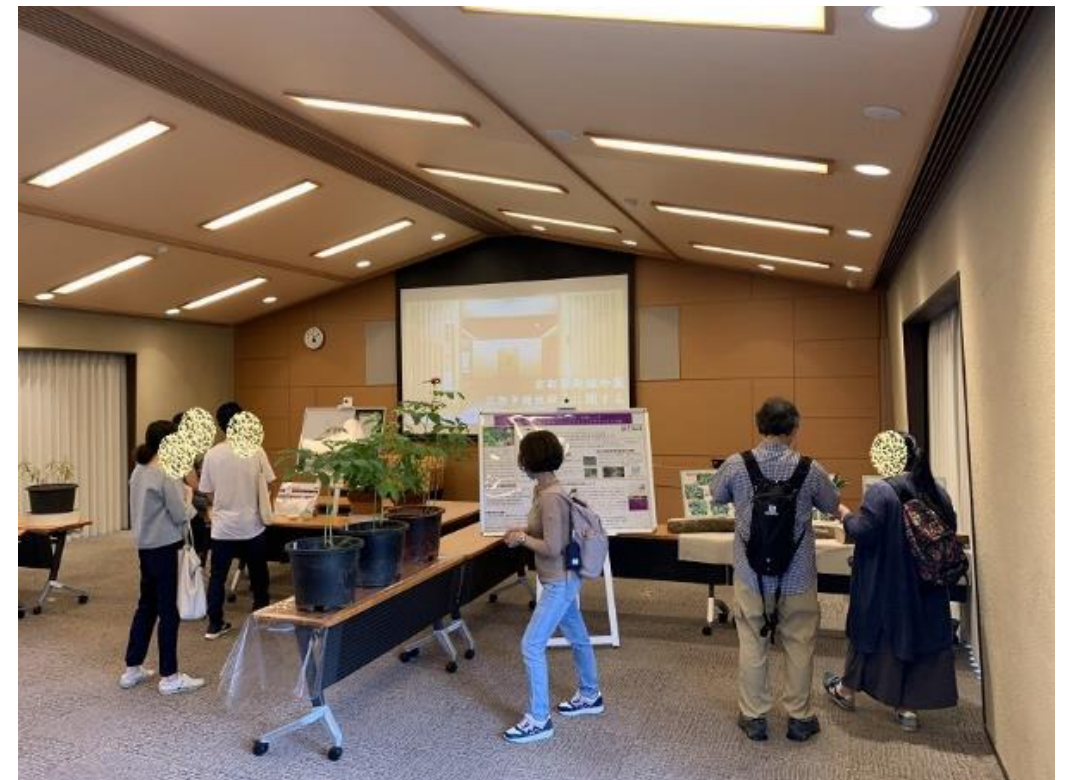
「雲ヶ畑・足谷 人と自然の会」活動紹介