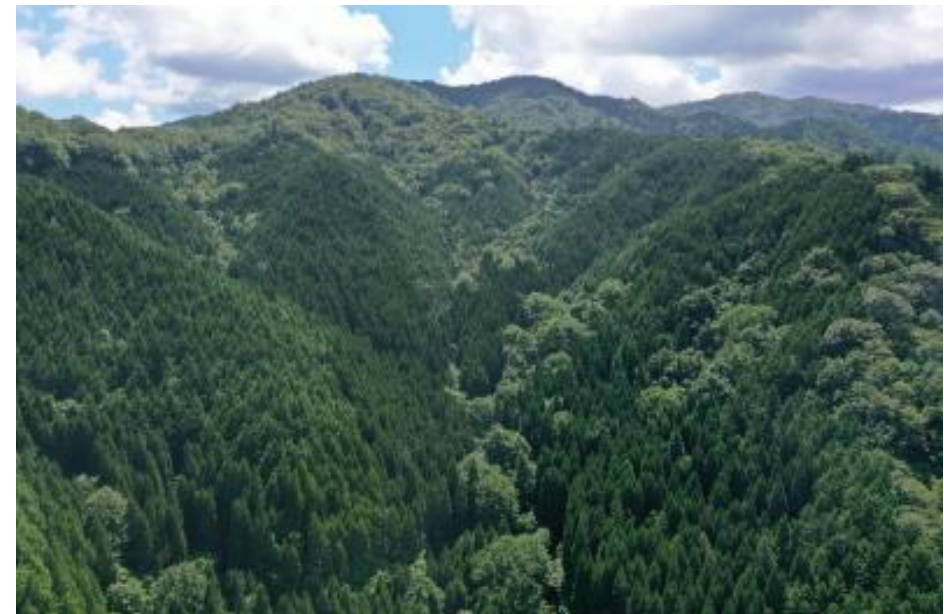
令和5年度後期認定 三井物産の森/清滝山林