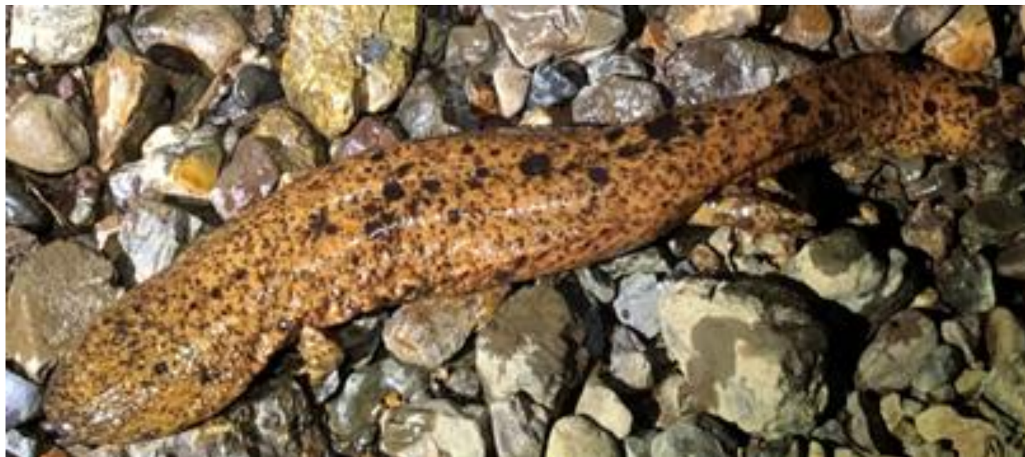
オオサンショウウオ（在来種）