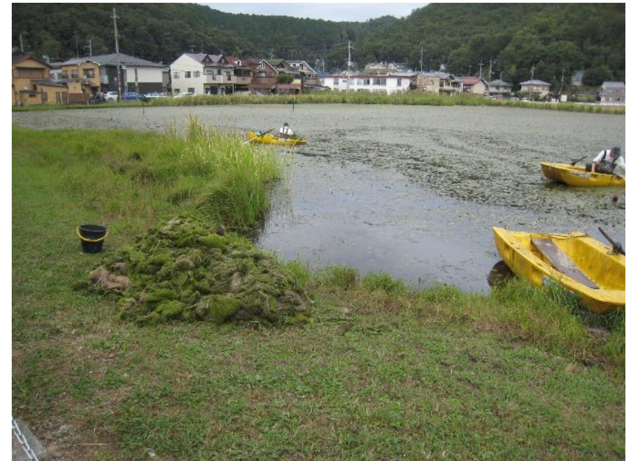
オオバナイトタヌキモ除去作業