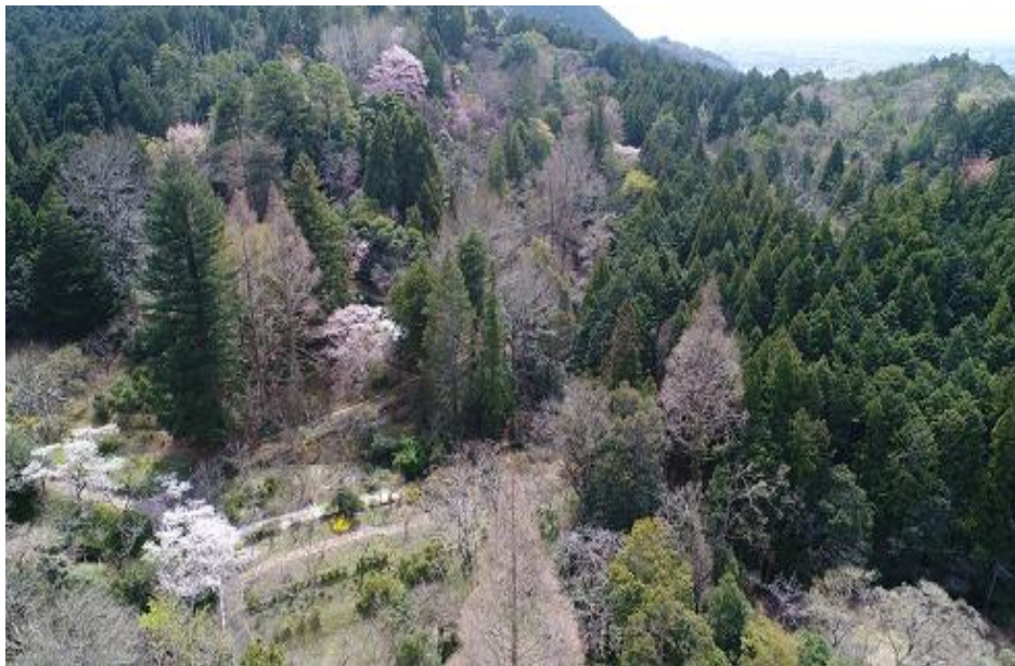
令和5年度前期認定 武田薬品工業(株) 京都薬用植物園内の樹木園