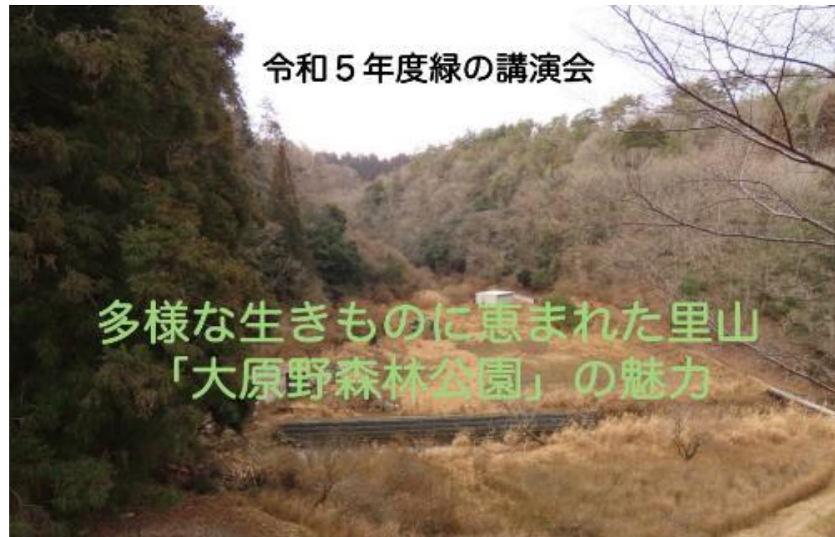
ポータルサイトにおける情報発信