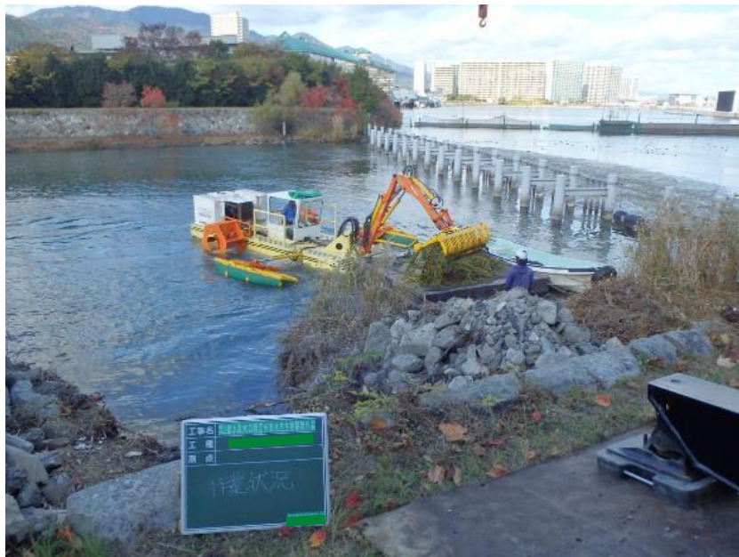
オオバナミズキンバイ駆除活動