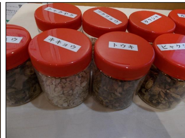
パネル及び生薬の展示