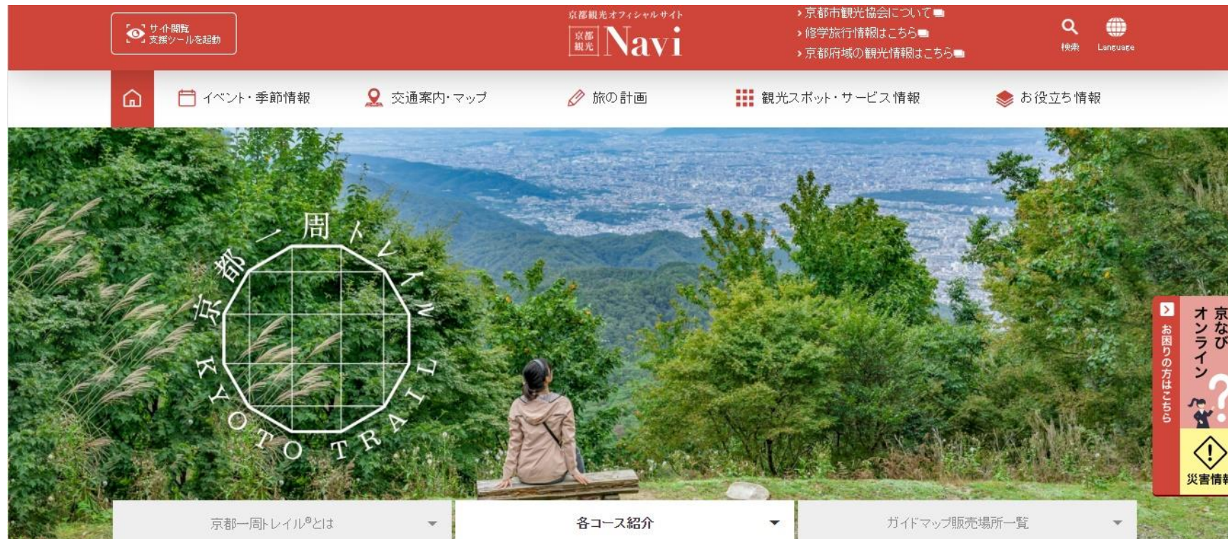
ホームページ「京都観光Navi」京都一周トレイル