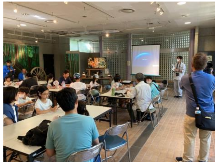
植物園「いきもの広場」