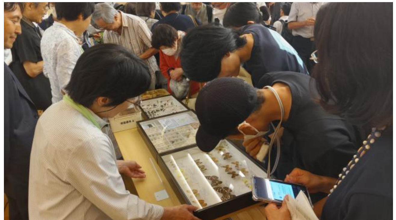
昆虫標本等の展示