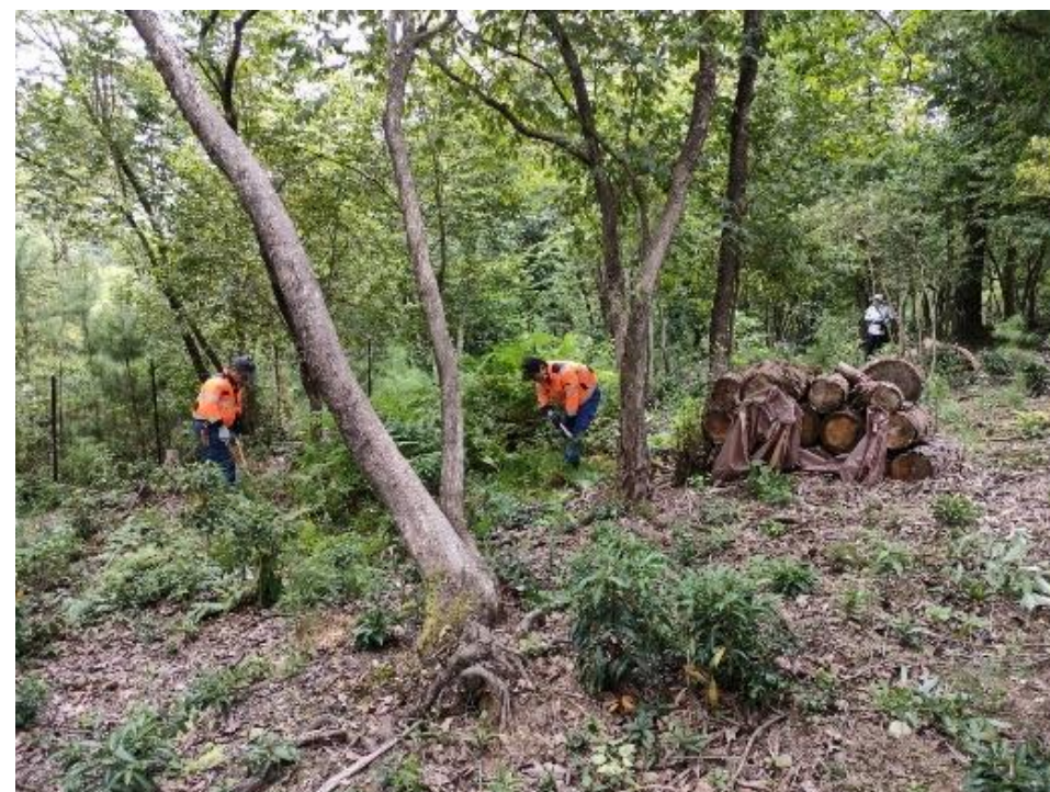
小倉山における維持管理活動の様子