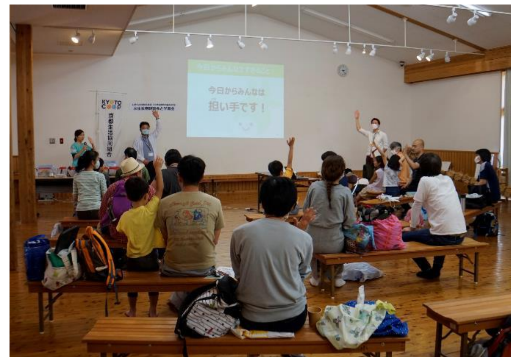
いきもの学校 京北編