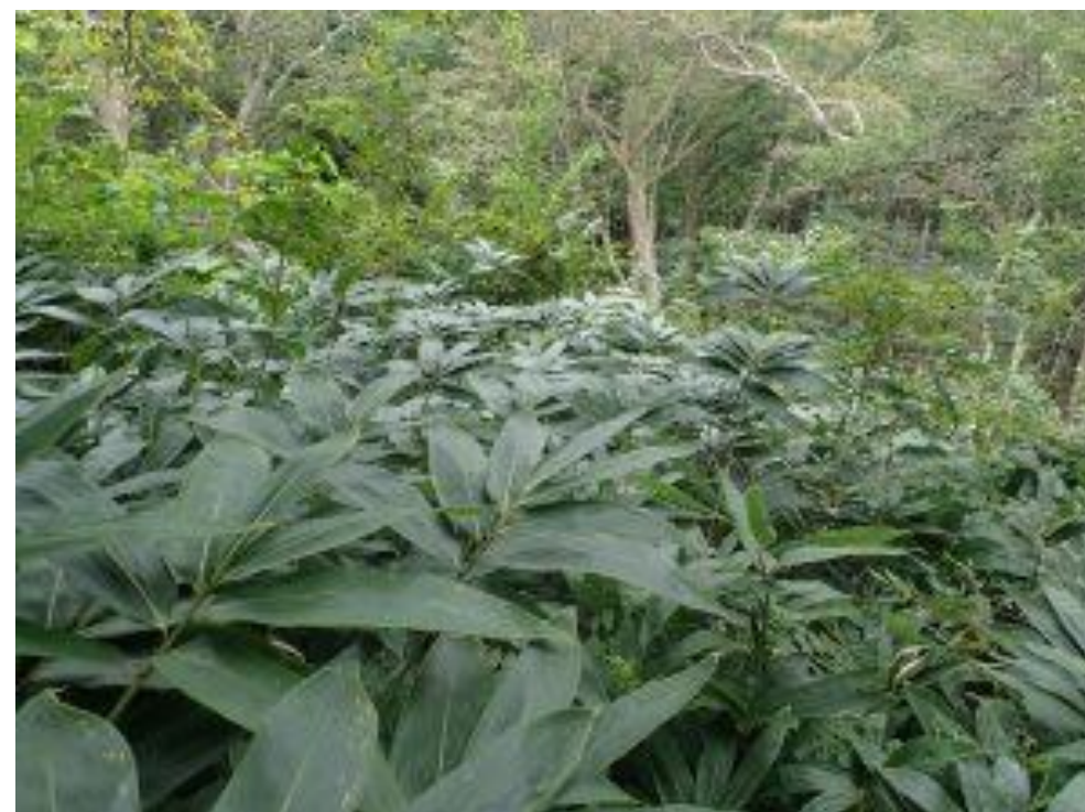
保護区内のチマキザサの生育状況