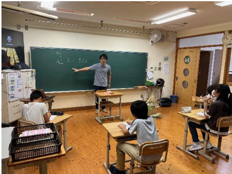
花背小中学校での学習会の様子