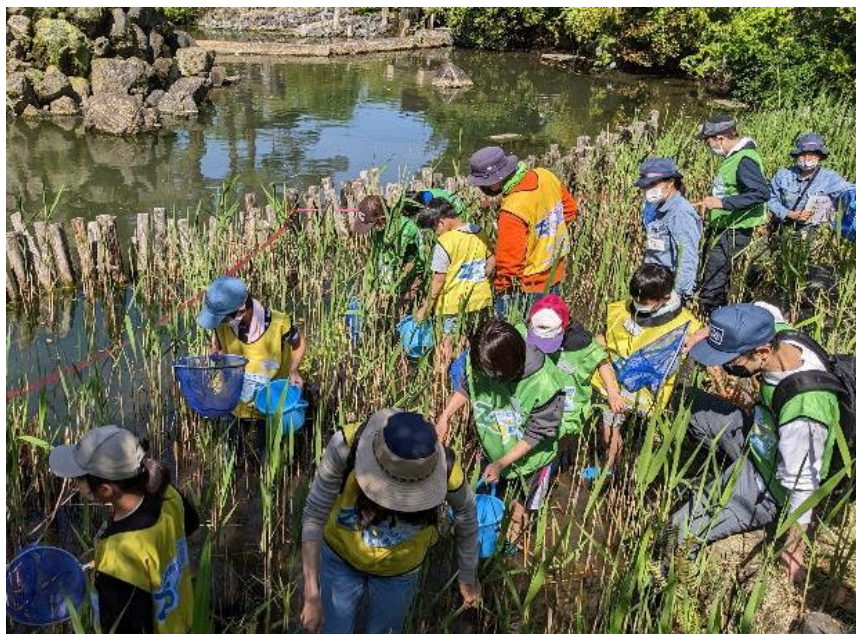
イチモンジタナゴプロジェクトの様子