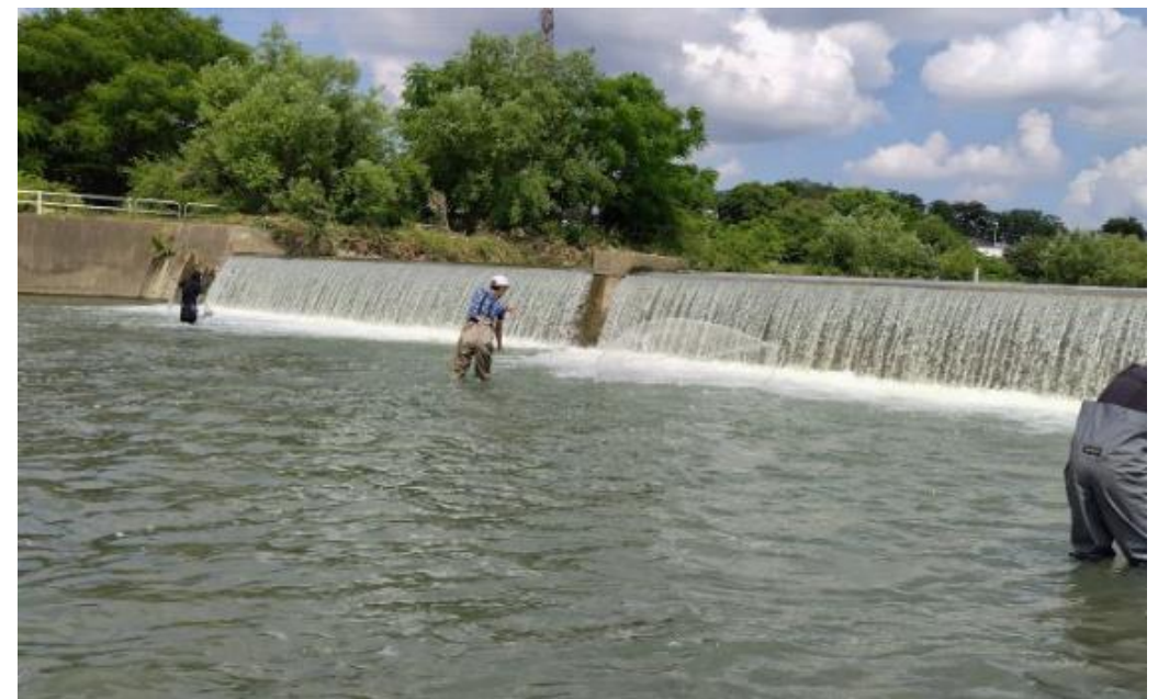
桂川での汲み上げ放流