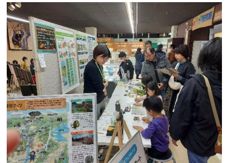
青少年科学センター 「サイエンスフェスティバル」