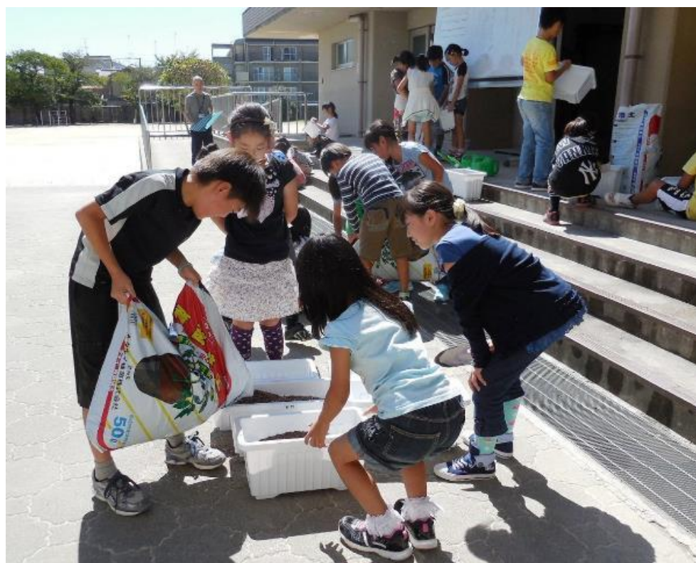
京都青果合同(株)等との連携による食育授業