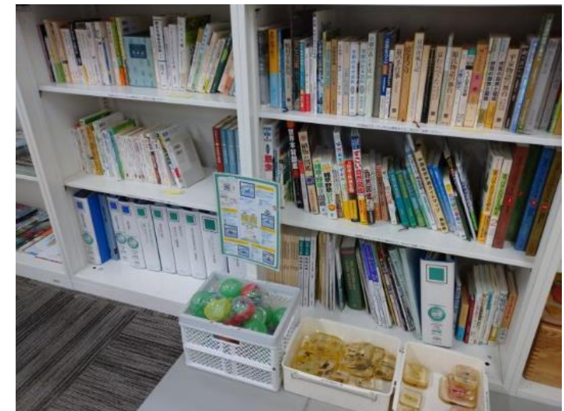
交流オフィス 書籍閲覧