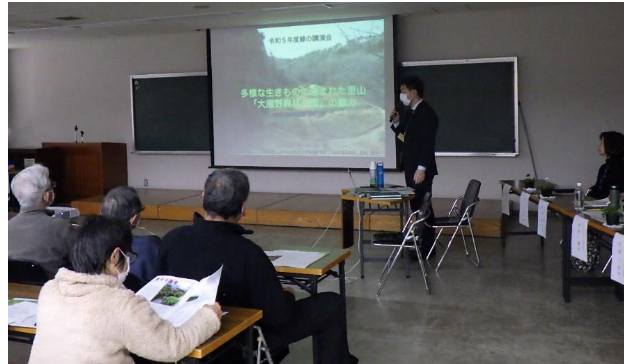
「緑の講演会」の様子