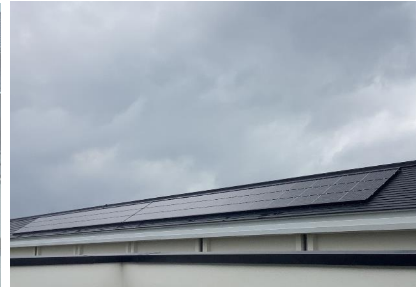
太陽光発電（開建高校）