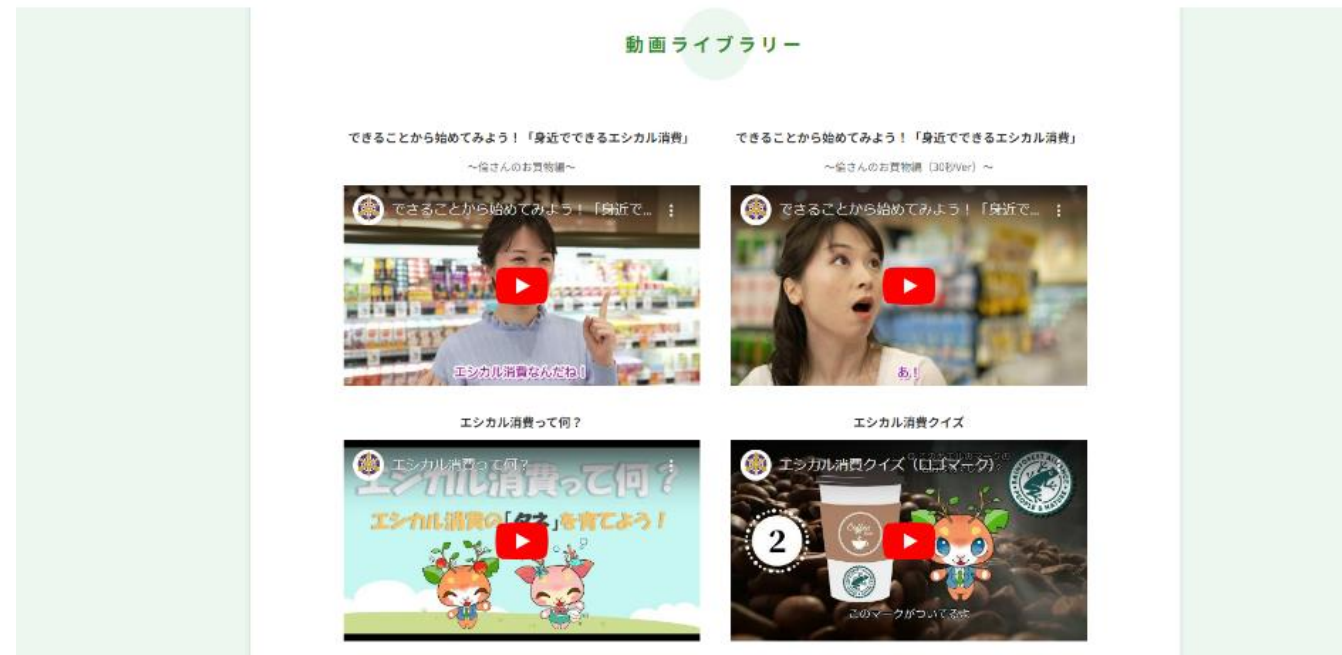
ホームページ上の動画ライブラリー