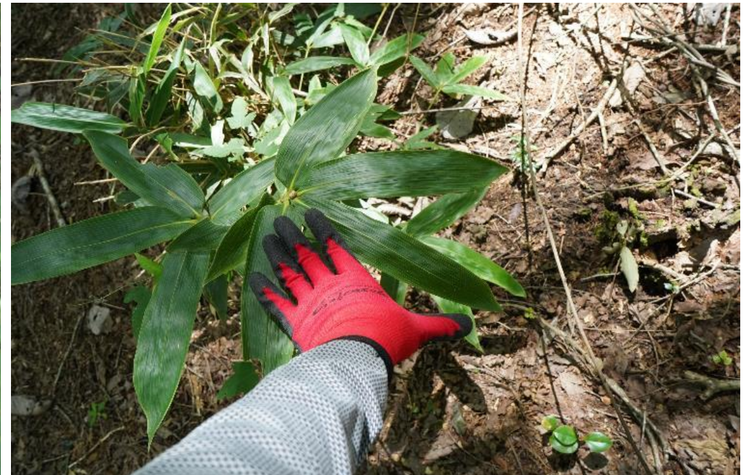
モニタリングの様子