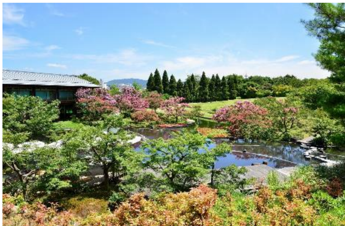
梅小路公園 朱雀の庭の様子