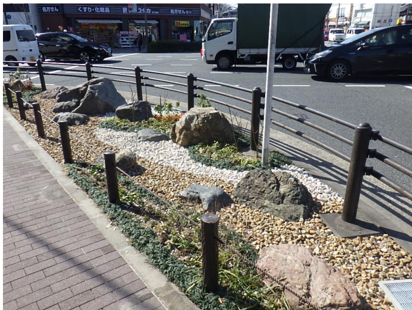
東大路今出川交差点