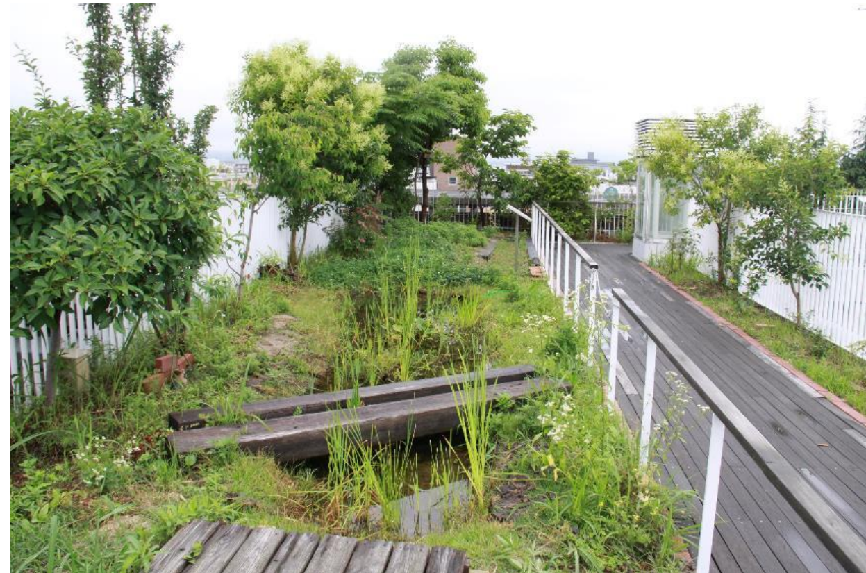
屋上ビオトープの様子