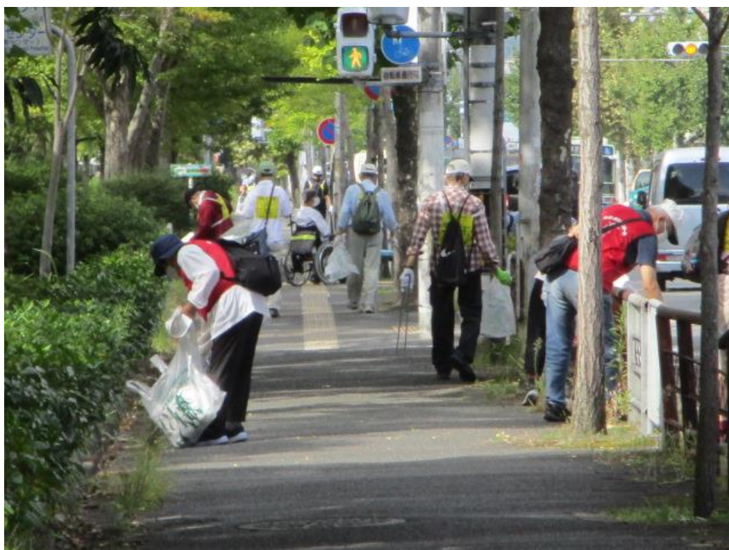
友・遊・美化パスポート事業の活動風景