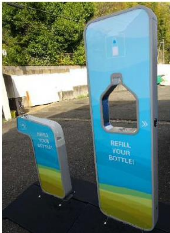
イベント用給水機