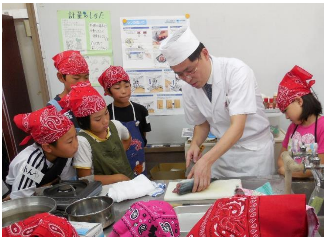
小学校出前板さん教室