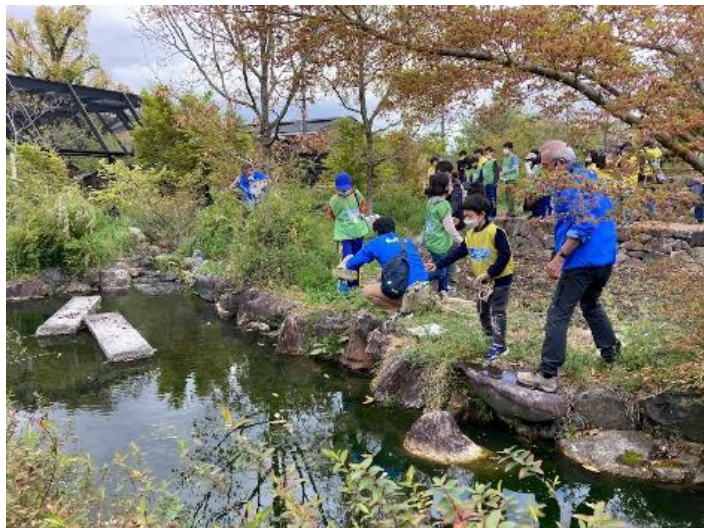
動物園「野生動物学のすすめ」