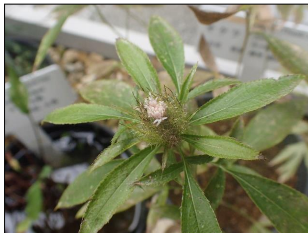
生息域外保全しているキキョウ及びオケラ