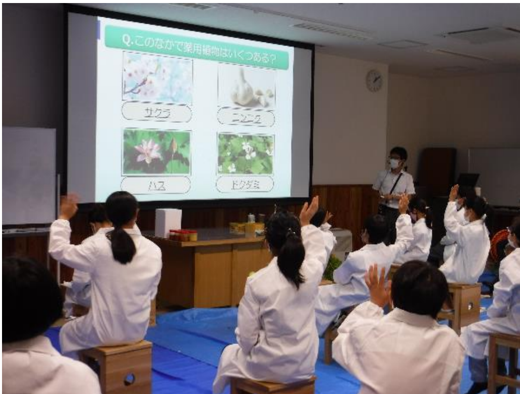
未来のサイエンティスト養成事業