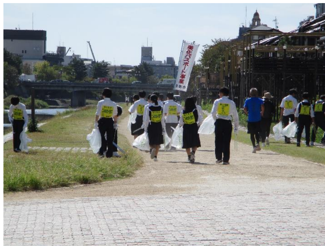
一日美化パスポート事業の活動風景