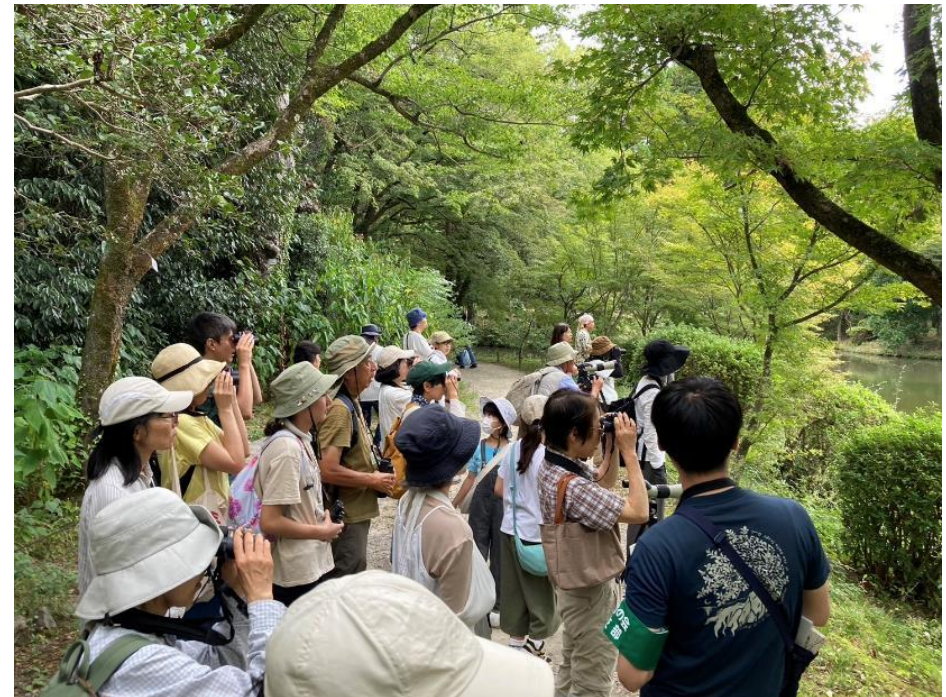
きょうと☆いきものフェス（自然観察会）の様子