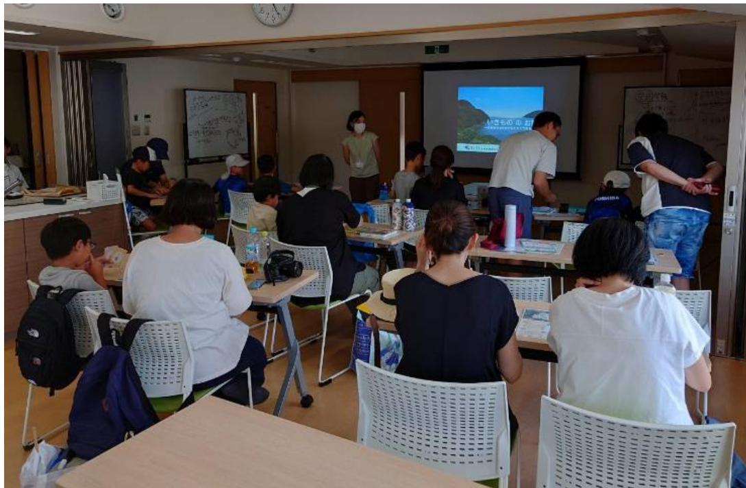
洛西高架下こども大学～らくさい生き物ラボ～

組合員向けイベント(いきもの学校)で講演(一般参加者：31名、うち子ども16名)