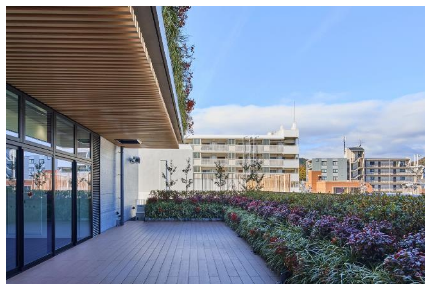
屋上緑化（西京区総合庁舎）