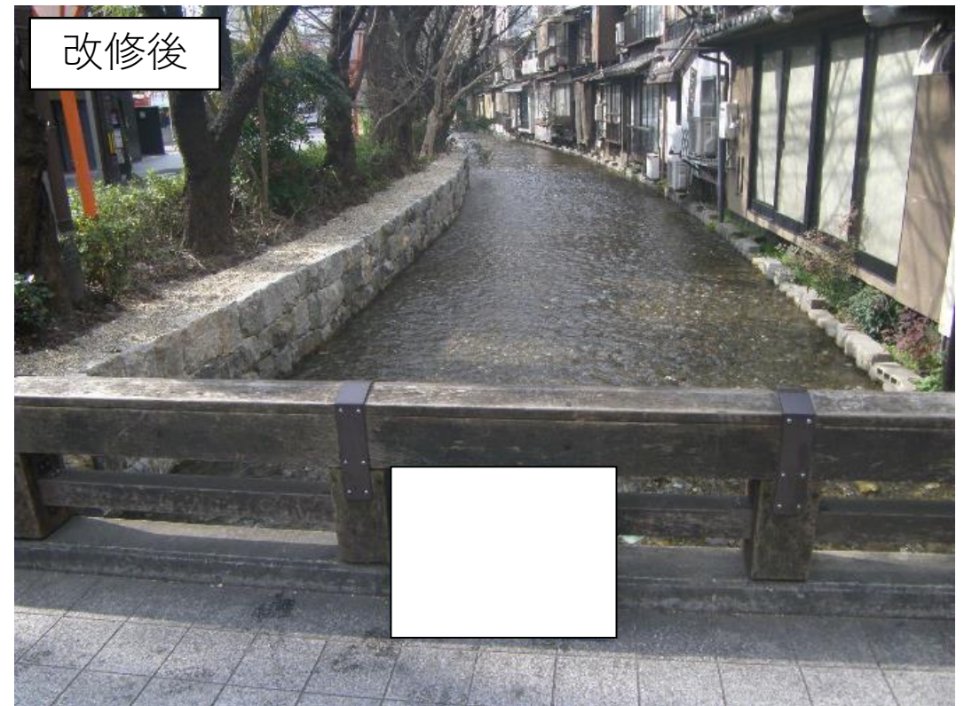
河川改修工事前後の様子 ※事業者名が記載されている箇所は隠しています