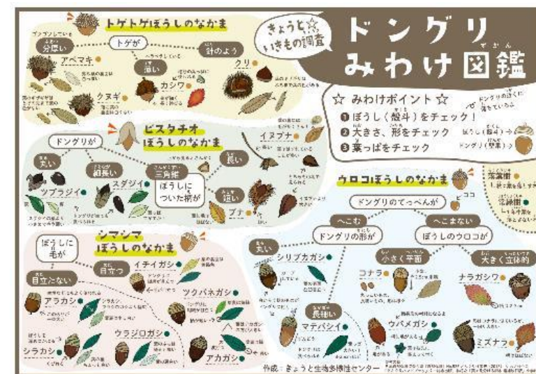
ドングリみわけ図鑑