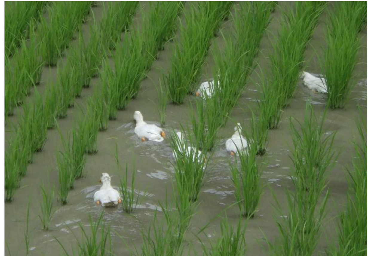
有機農業の取組（アイガモ農法）