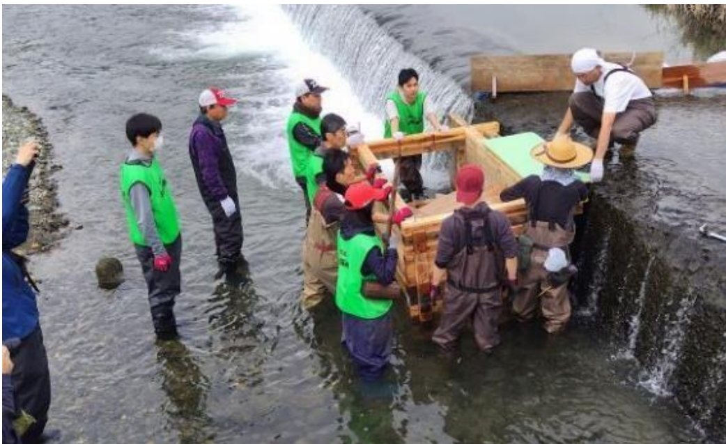
鴨川での魚道設置