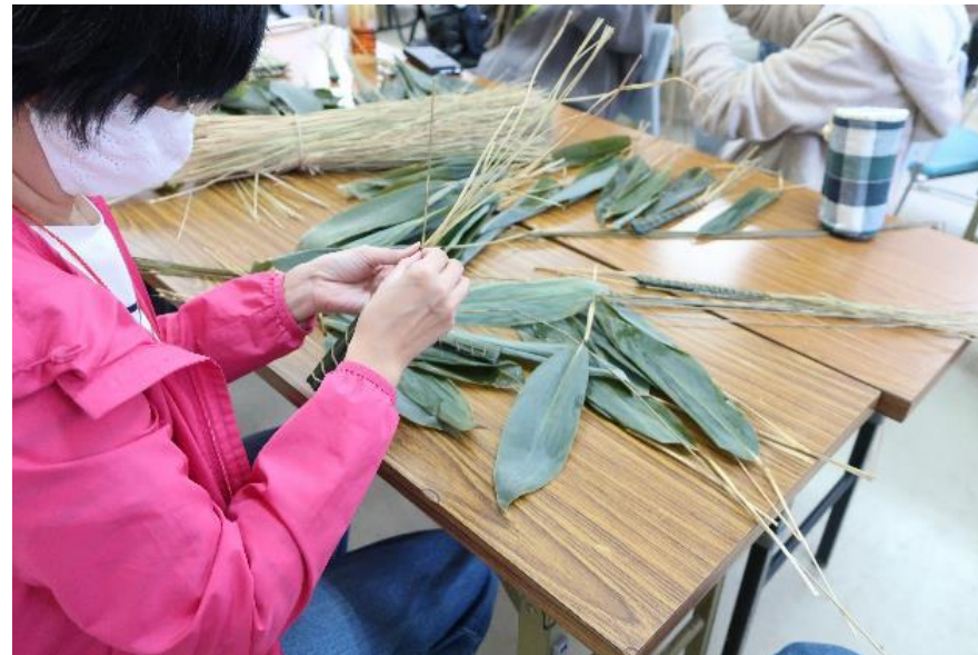
厄除け粽づくり体験の様子