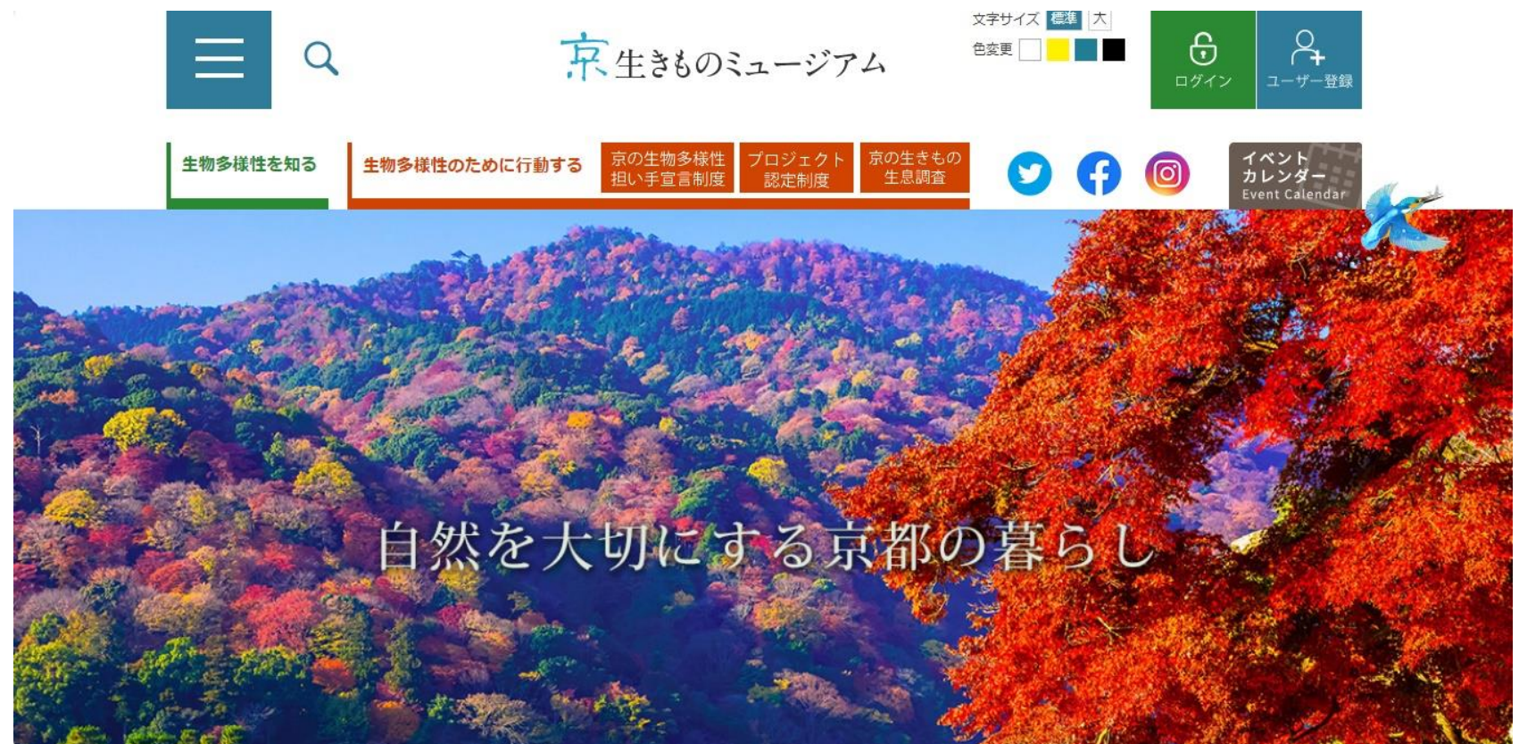
ポータルサイト「京・生きものミュージアム」