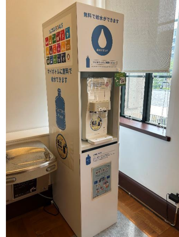
給水機（市役所本庁舎）