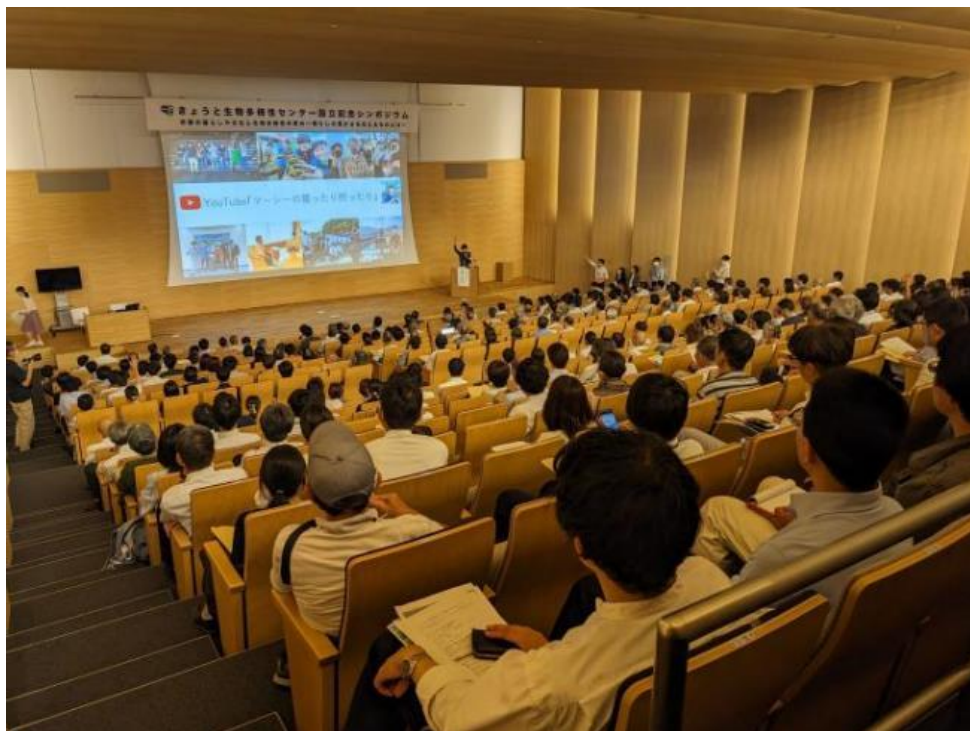
設立記念シンポジウム 講演