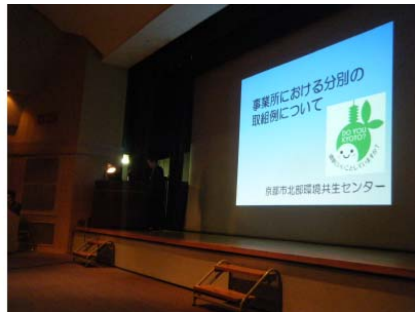
事業所取組事例紹介