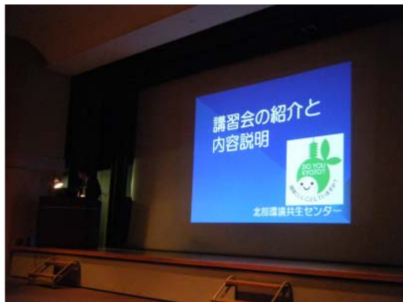
講習会の説明と内容説明