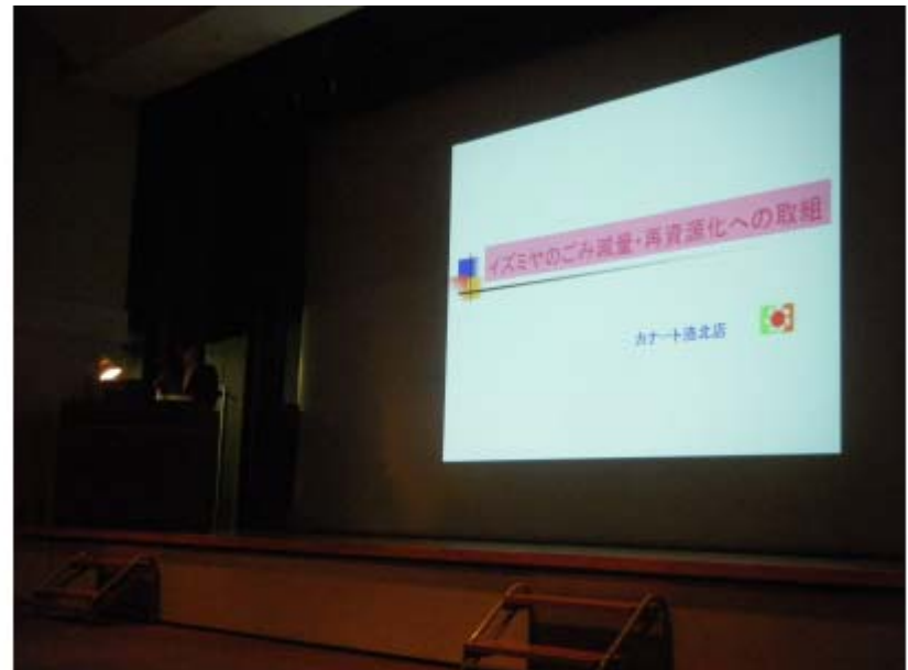
ごみ減量・3R活動優良事業所の取組紹介