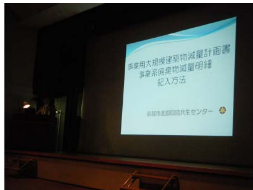
提出書類の記入方法