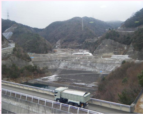
エコランド 音羽の杜