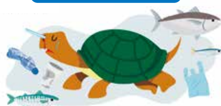
海洋生物への影響