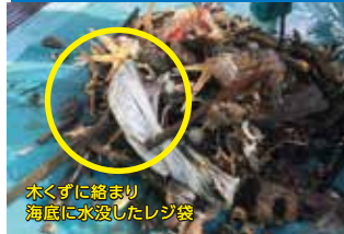
大阪湾で引き揚げられたごみ