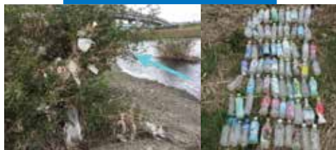
桂川に滞留したごみ

A 容器包装リサイクル法の関連省令の改正により、レジ袋の有料化が義務になります。使い捨てプラスチックによる海洋汚染の深刻化や地球温暖化などの解決に向けた第一歩として、レジ袋の有料化を通じて、消費者がマイバッグを持参するなど、ライフスタイルの見直しを促し、過剰な使用を抑えていくことが目的です。レジ袋削減に御協力をお願いします。