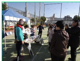
防災訓練でのエコブース出展