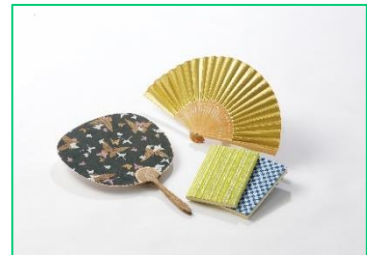
大平印刷による友禅印刷の応用例