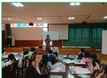
小学生向けのワークショップ

小学生や若い世代の環境への意識を高め、それをきっかけに上の世代にも波及させることで地域力アップを目指し、「衣食住」をテーマに、専門講師等によるエコに係る講義と古着のリメイクやエコクッキング等のワークショップを組み合わせたイベントの開催、防災訓練でのエコブースの出展等に取り組まれています。