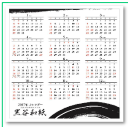
黒谷和紙に墨インクを使ったカレンダー (原料:コウゾ) (原料:コウゾ)

和紙原料の廃棄物利用として、「コウゾ」と「ミツマタ」の炭に着目し、共通の炭焼き方法を確立し、その炭が持つ消臭機能等を明らかにするとともに、印刷しても消臭機能等を失わない「墨(炭)インク」を開発されました。また、友禅染を応用した友禅印刷等に墨インクを利用して名刺等の作成に取り組まれています。