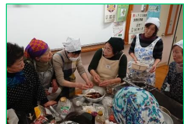
京エコロジーセンターでのエコクッキング