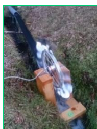
水車を用いた小水力発電

左京区八瀬地区において、身近な自然の豊かさや魅力に関心を持ってもらうため、地域住民が主体となり、小水力発電を活用した大晦日の参道のライトアップやロケットストーブの作成など多様なイベントを開催し、再生可能エネルギーを中心としたライフスタイルを提案する活動に取り組まれています。