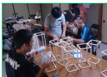
イベントの準備に励む活動メンバー