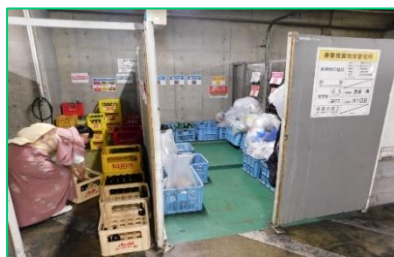
ごみ集積場での廃棄物の徹底分別