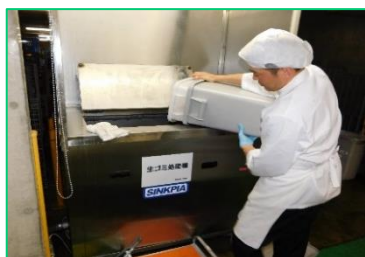
最新鋭の生ごみ処理機

地域社会の一員としてリデュース（発生抑制）をはじめとした3R活動等を推進するため、生ごみを排水に変える最新鋭の生ごみ処理機の導入や廃棄物の分別・計量・記録の徹底、レストランや宴会での食材の地産池消、地域の清掃活動への積極的な参画等に取り組まれています。