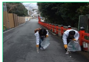
東山花灯路に向けた事前の清掃活動