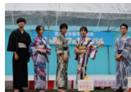
京都学生祭典「浴衣ファッションショー」