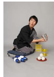
和風大道芸「トルマリ」