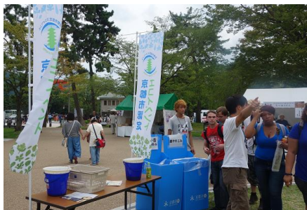
京都市認定エコイベントのぼり