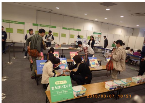
さんばい分別ゲーム