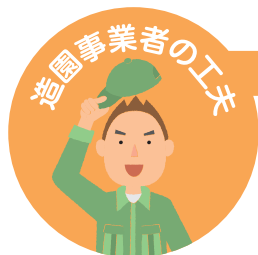
造園事業者の工夫