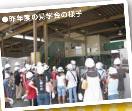
● 昨年度の見学会の様子