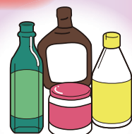
びん類 (ワンウェイびん)