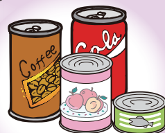
アルミ缶・スチール缶