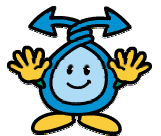
쓰레기 감량 마스코트 「도쿄도노아이」

제도 도입으로, 가정으로부터 배출되는 쓰레기(정기 수집 쓰레기)가 20% 줄어 든다고 예측하고 있습니다. 보다 좋은 지구 환경을 다음의 세대에 계승하는 것은, 지금을 사는 우리의 사명입니다. 쓰레기 감량과 재활용의 심화된 추진은, 이산화탄소등의 온실 효과 가스를 삭감할 수 있어 지구 환경 문제의 해결로 연결됩니다.