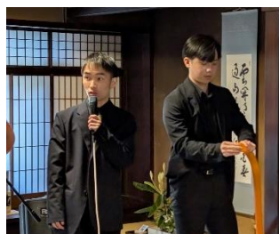
同大生のマジック・ショー

全日のイベントに9組のすばらしいミュージシャンと1組のマジシャンを迎え、様々な年齢層のボランティア・観客の方々にご参加くださいました！be-京都の和室とギャラリーが音楽と笑いのあふれる場になり、日頃出会わない方々とも新しい出会いとコミュニケーションが生まれました。フォーク文化・西陣織の展示に加え、地元商店の商品を販売して宣伝もさせていただきました。平日開催や宣伝の遅れのせいか、来場者は期待を下回りましたが、会場は大変盛り上がり、出演者・スタッフ・来場者の多くから大変満足したとの感想をいただき、来年度「第2回」開催に参加の意欲を示してくださいました。今度の成果を踏まえ、是非よりよいイベントを目指し活動を続けていく所存です。