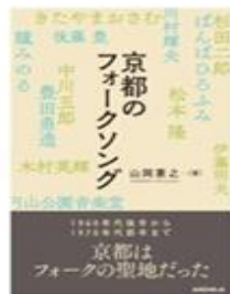
「京都のフォークソング」ミニ展示と本の展示・販売