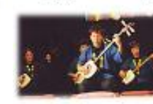
洋輔三味線・花水鼓子-2 じげん