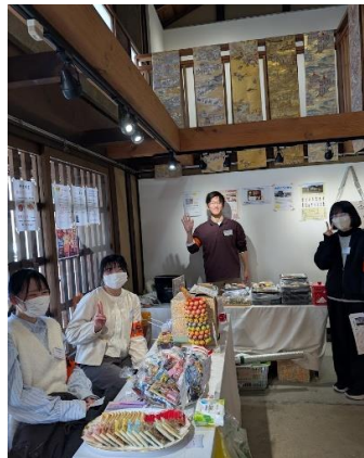
学生ボランティア・スタッフ