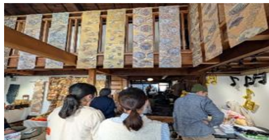
演奏に聞き入る参加者たち