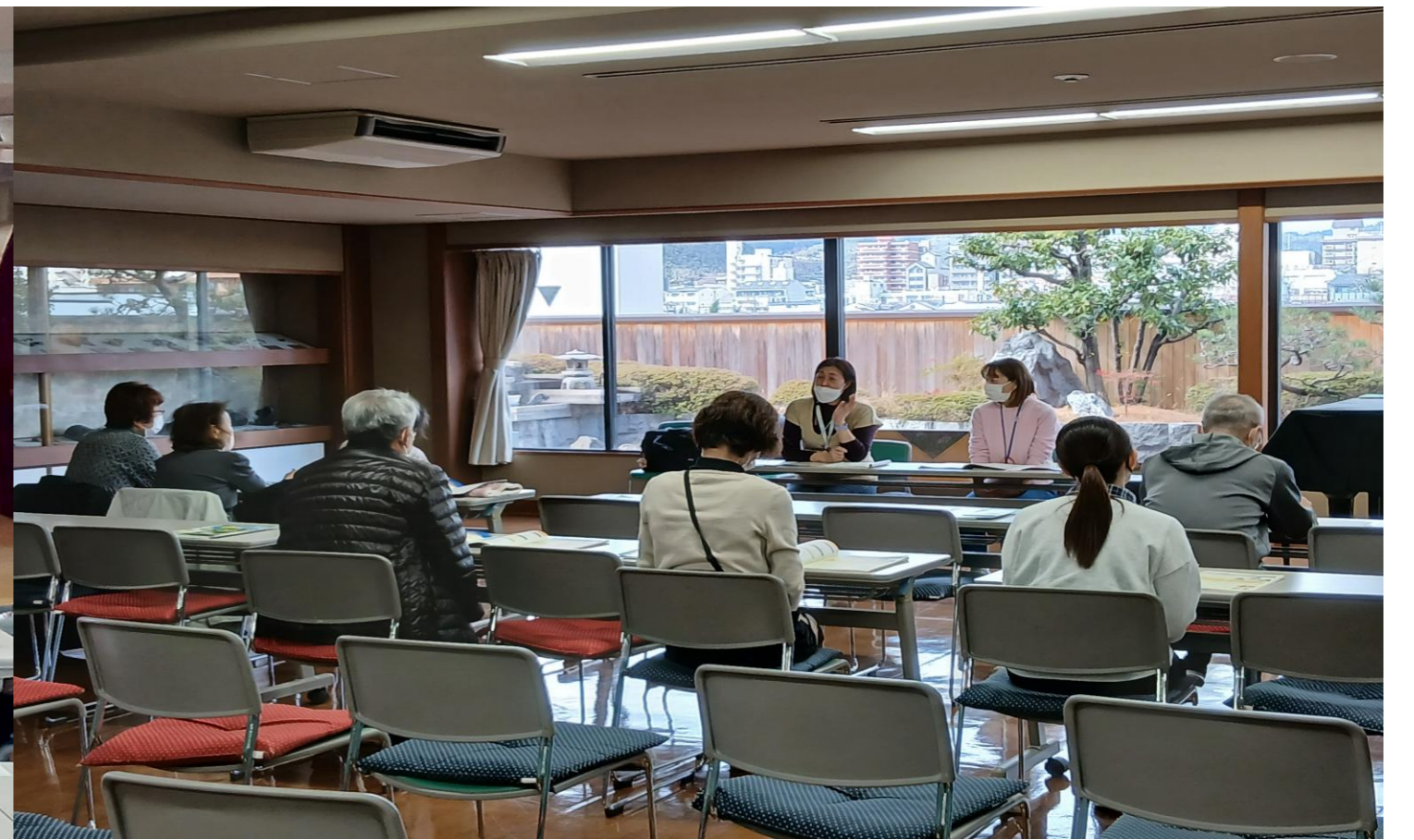
第18回「地域包括支援センターってどんなところ？」