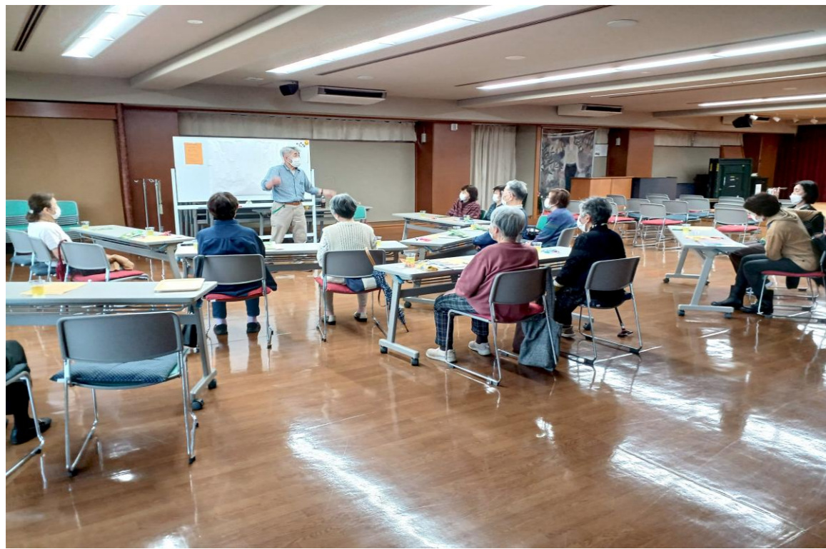
第13回「健康ぞうしん井戸端会議」