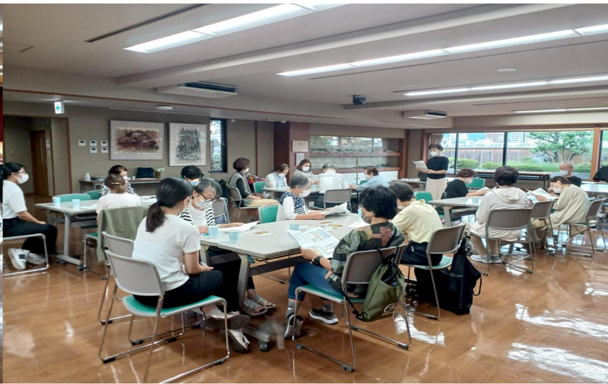
第14回「もしバナゲーム」の様子