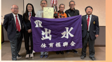
出水A体振チームの皆さん