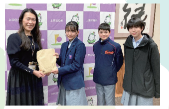
原区長と嘉楽中学校生徒会本部の皆さん

2月9日、嘉楽中学校生徒会本部の皆さんが上京区役所を訪れ、義援金118,081円を届けていただきました。これは、生徒の皆さんが自主的に企画し、校門前や千本今出川交差点、上千本商店街において行った募金活動により集められたものです。義援金は、日本赤十字社を通じて被災地の支援にあてられます。 ☎=地域力推進室(まちづくり推進担当) (☎441-5040、1階①番窓口)