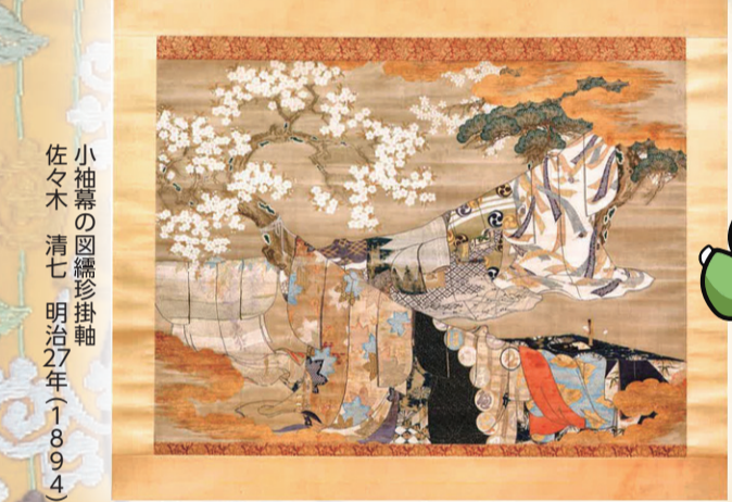
小袖幕の図織珍掛軸 佐々木清七 明治27年(1894)

☎=西陣織会館 (☎451-9231) ※休館日：毎週月曜日 (月曜祝日の場合は翌日火曜日)