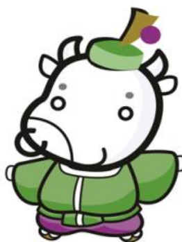
上京区マスコットキャラクター

令和2年度の対象事業報告 ポスターを4月19日（月） から4月30日（金）まで、 区総合庁舎1階ロビーで展示 します。