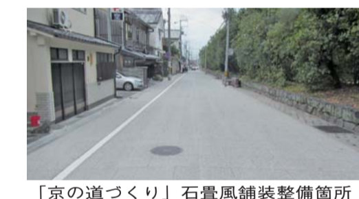
「京の道づくり」石畳風舗装整備箇所

周辺は、古くから門前町として発展し、北野上七軒のお茶屋や京町家が立ち並ぶ場所です。美しい石畳風舗装の道を歩き、この町の歴史と文化を感じてみませんか。 ☎北部土木事務所 (☎492-3111, FAX 492-5036)