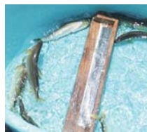
※写真は全て当日の様子