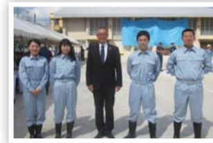
2号消火栓の部「優秀賞」をいただきました。