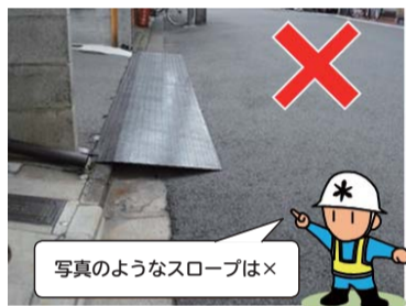
写真のようなスロープは×

北部土木事務所です 道路にスロープ等の 設置はできません 排水や通行の支障となるため、道路に鉄板やプラスチック板のスロープを置くことはできません。車等の出入りのため、歩道の切り下げ工事等を実施する場合は、許可が必要です。誰もが安全に道路を利用