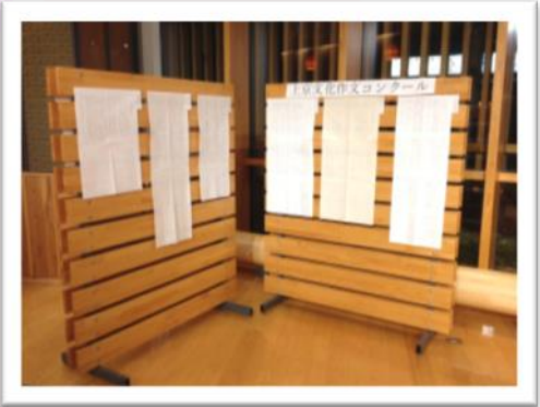
区民交流ロビー（ここ！）にも展示！