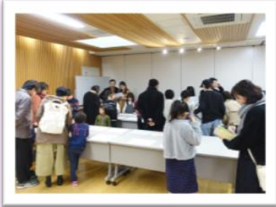
作文をみなさんに読んでいただきました！