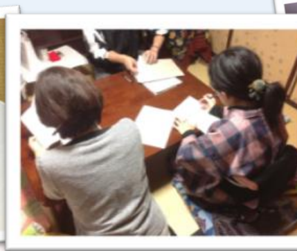
京都人度チェック！