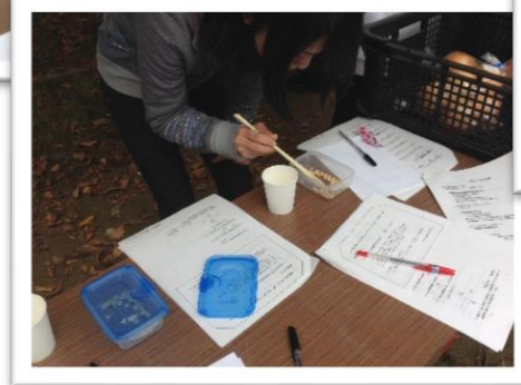
正しいお箸使い、京都人ならできるはず♪