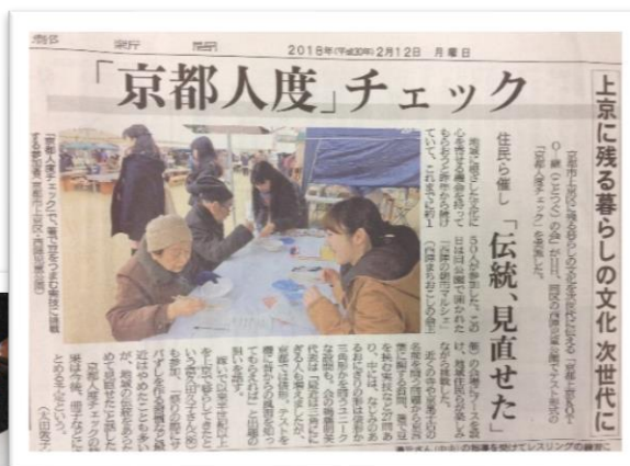
京都新聞に掲載していただきました！