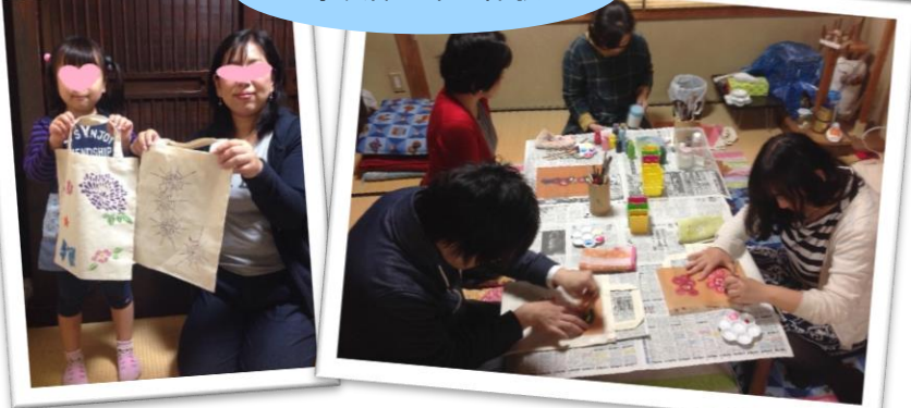
京友禅型染め体験