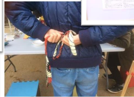
ちょうちよ結び、まっすぐできるかな？！