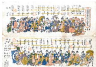
祇園神輿り物絵巻(天保6年版)