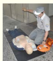
AEDによる電気ショックを行っている様子