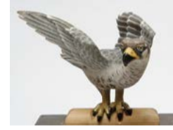
鷹山の会所飾りの鷹(木彫)【鷹山保存会蔵】