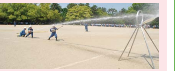
小型動力ポンプを使った消防訓練