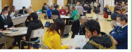
絆工房(ワークショップ)の様子

このたび、各種団体の代表者や大学生の参加のもとで、より効果的な広報活動や区内の大学生と連携した地域活動など、具体的なアイデアをワークショップ形式で話し合いました。