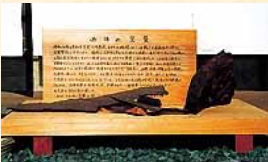
山中油店の店頭に表示されている 爆弾の破片

明治末期には、市電が走り、昭和3年には「大礼記念京都大博覧会」が開催され、跡地にJOOK京都放送局と二条児童公園が設置されました。