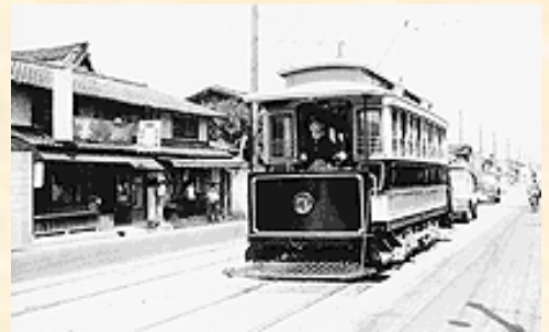
中立売通のチンチン電車

明治33年には、中立売通にチンチン電車の北野線（京都駅～北野）が、大正元年には千本通にも市電が開通し、千本中立売界限を中心に座館や商店が軒を連ね、西陣織の活況ともあいまって急速に発展しました。そのにぎわいは下の新京極にもおとらず、庶民が気軽に歩けることから「ゲタばき京極」という言葉も生まれました。