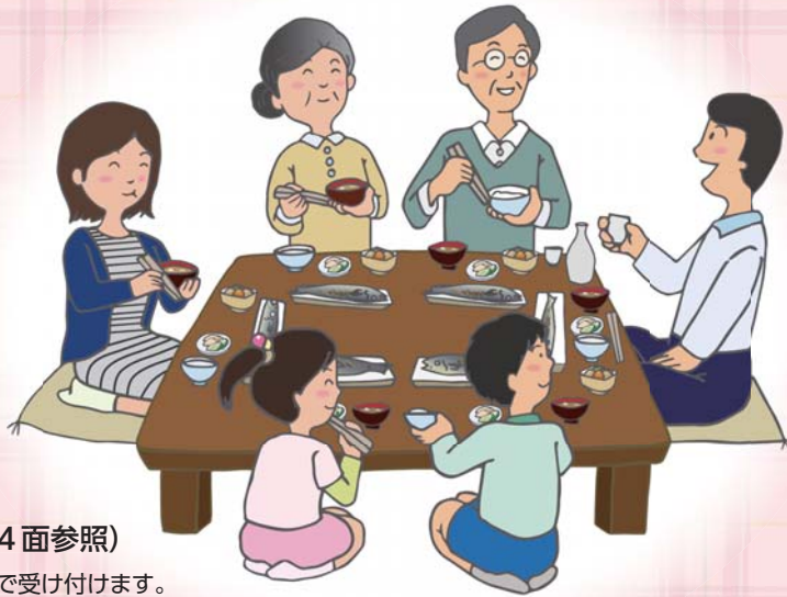
イラスト制作: NPO法人 ANEWAL Gallery