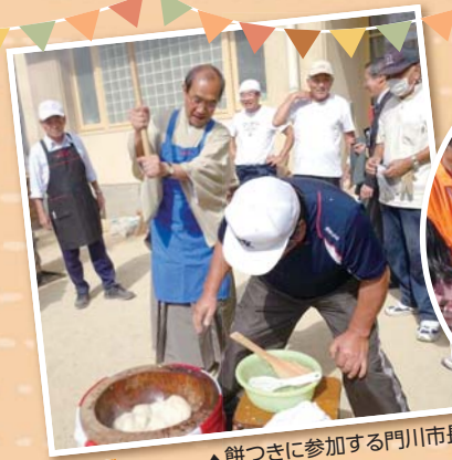
▲餅つきに参加する門川市長