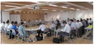
上京区推進協議会総会