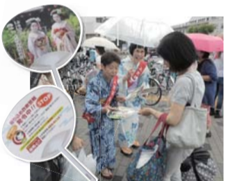
特殊詐欺被害防止の啓発活動