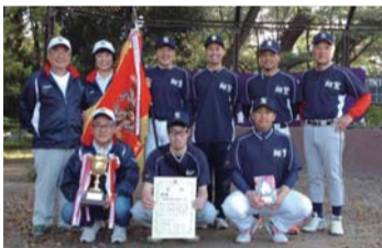
1部優勝の翔鸞体振チーム

1部優勝の翔鸞体振チームは、7月24日に開催される京都市ソフトボール大会に、上京区代表として出場します。