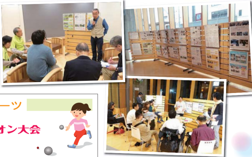
ポスター展示とポスターセッション