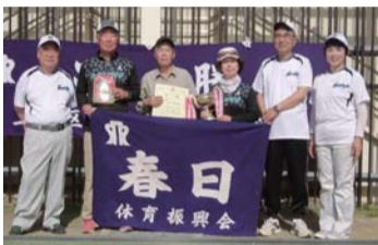
優勝 春日体振チーム