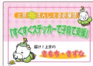
すくすくステッカー

また、「えんじえるカード」は、「こんにちは赤ちゃん訪問」の際や区内の保育園、幼稚園、小学校、「上京の子どもまつり」、区役所仮庁舎プレハブ棟2階(17番窓口)でも配布しております。