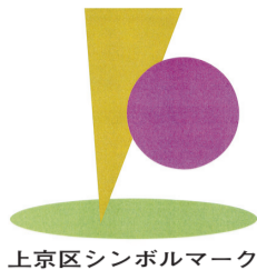
上京区シンボルマーク

上京区ホームページ http://www.city.kyoto.lg.jp/kamigyō/