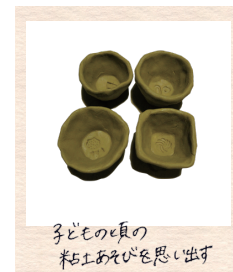
子どもの頃の 粘土あそびを思い出す