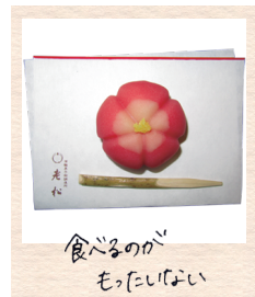
食べるのが もったいない

風情ある町家の和菓子屋さん。中へ入るとゆったりと静かな空間が広がり、町家の雰囲気漂う奥へ抜けて体験場所の 2 階へ。体験の手始めに京菓子の歴史や背景などを説明して下さいます。作るのは 5 個の生菓子。まず生地をこね、等分するところから始めます。先生が教えて下さった 2 種類を作った後は自由に作るの、自分だけのオリジナル和菓子を作りたいなら、あらかじめ和菓子の形や名前をイメージしておきましょう。作った和菓子は持ち帰ることができるので素敵なお土産にどうぞ。