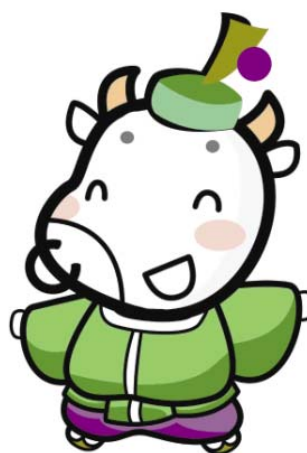
上京区マスコットキャラクター 「かみぎゅうくん」