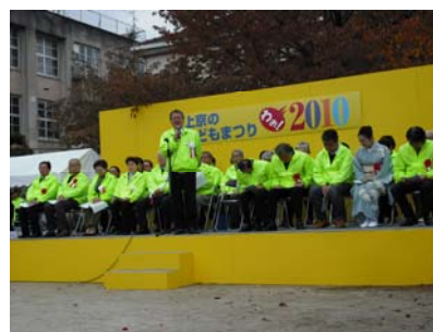
上京の子どもまつり