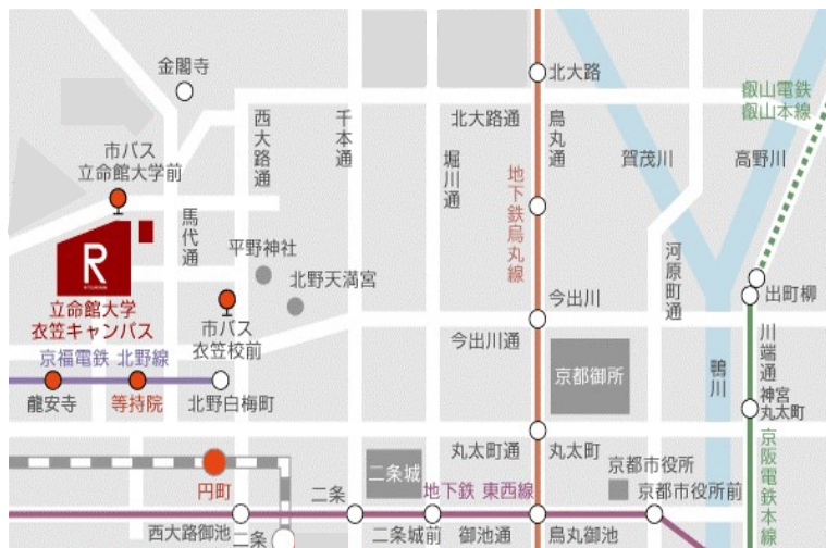
【キャンパス内地図】