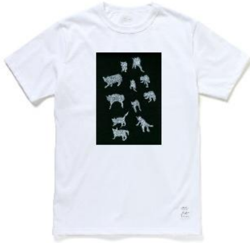
⑦ 「猫」 <花水木>