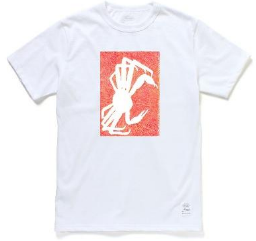
⑧ 「カニ」 <花水木>