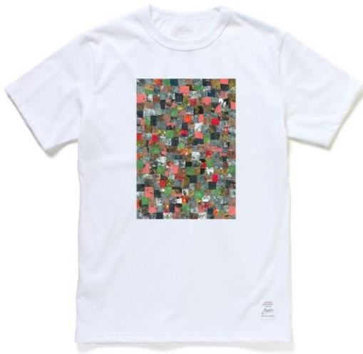
⑨ 「おまつりの風景」 <UTAU>