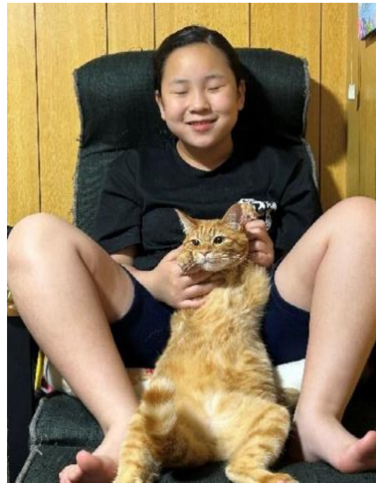
譲渡動物特別賞『絶賛ダイエット中!』