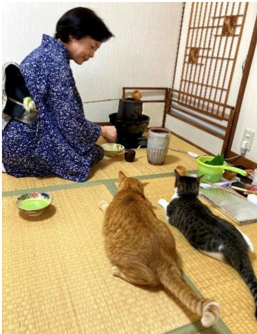
特選『おちゃはまだかい』